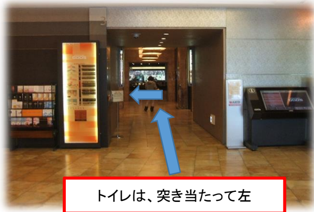
【写真:シナガワグース3階 発着所最寄りのトイレ付近】 ①3階(ホテルのフロントがある)の高速バス発着所と2階は、よく似ているので、要注意。 ②品川駅からシナガワグースまで徒歩5分。初めてご利用の方は、品川駅に遅くとも10分前に着かないと乗り遅れる。 ③高速バス車内にトイレがないため、トイレ時間を含むと駅に15分前到着がよい。