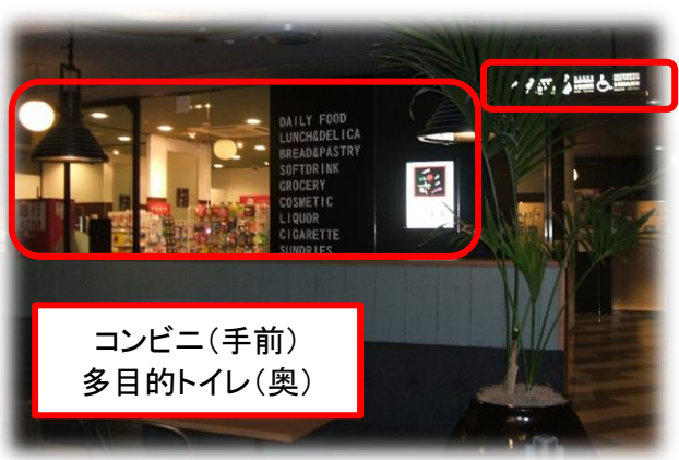
【写真:シナガワグース2階 コンビニ、多目的トイレ付近】 ①コンビニ、多目的トイレは、レストラン奥にある。