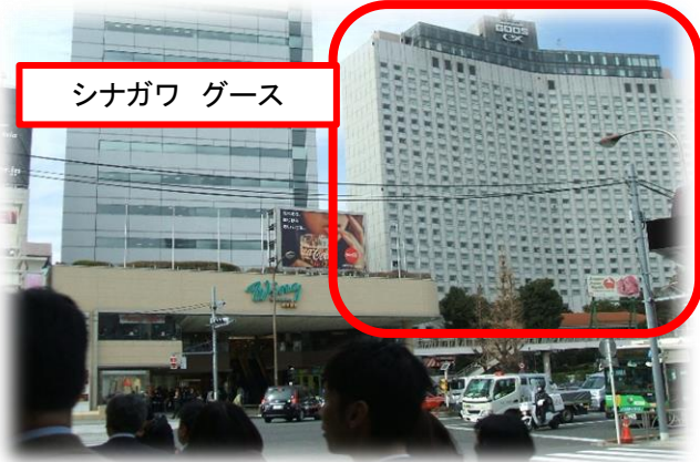
【写真:品川駅高輪口から見たシナガワグース】 ①いつも混雑しているため、雨天時注意。