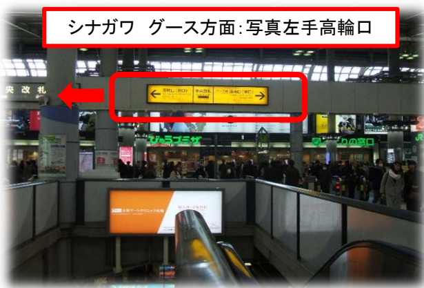
【写真:品川駅中央改札 高輪口(西口)表示】 ①いつも混雑している。 ②改札内に横浜銀行のATMあり(千葉銀は通常手数料なし)。