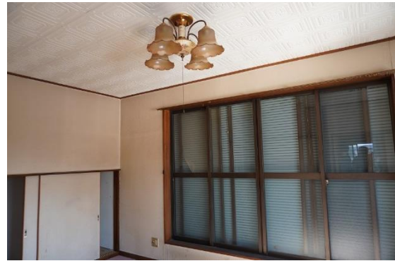
2F 寝室 (7.5 畳)