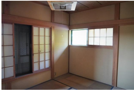
2F 和室 (6 畳)