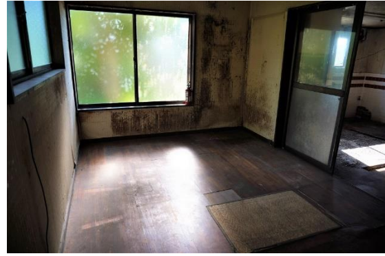
洋室 (6 畳)