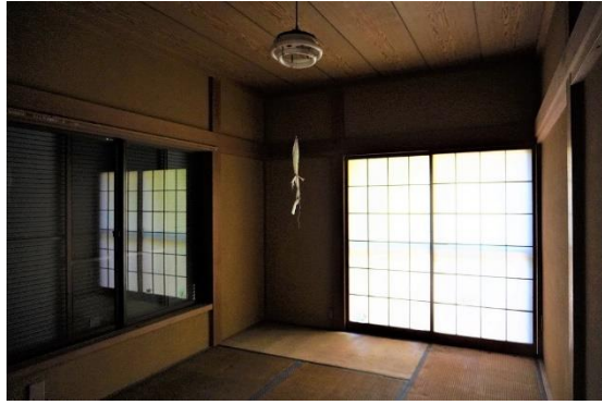
和室 4 (6 畳)