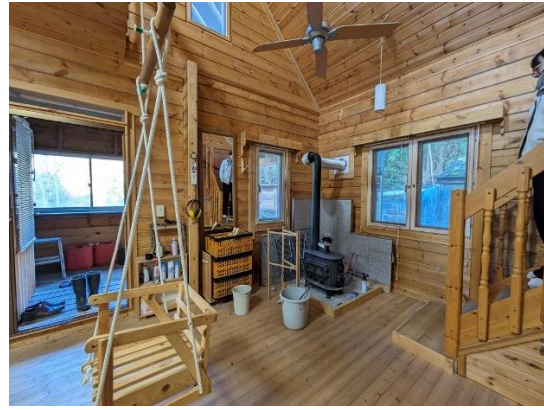
リビング (薪ストーブ側)