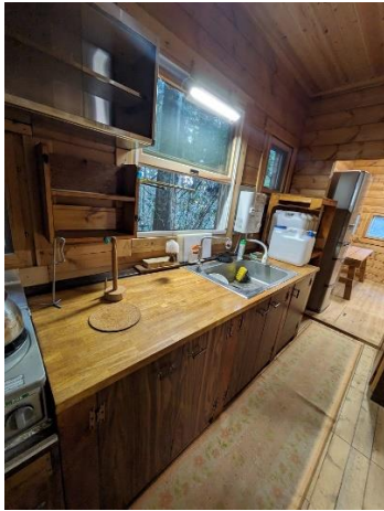
キッチン (奥はダイニング)