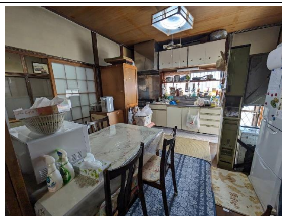
ダイニング 8 帖