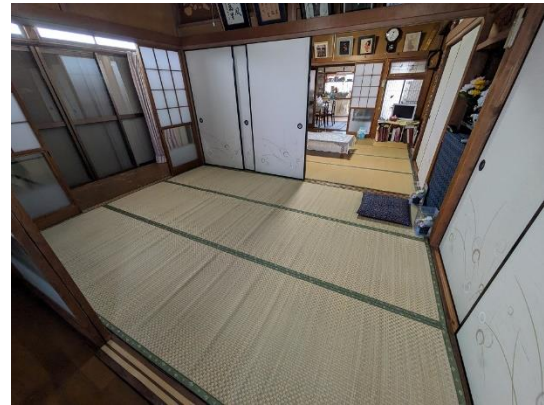
和室 6 帖 (続き間)