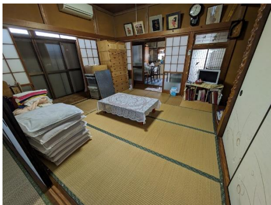
和室 8 帖 (続き間)