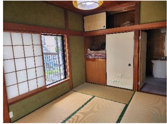
2階 和室 6畳 (バルコニー隣)