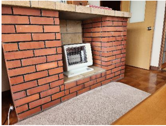
暖炉風 (洋室 10畳)