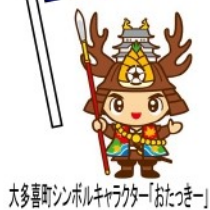
大多喜町シンボルキャラクター「おたつきー」