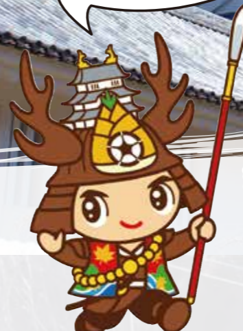
大多喜町 シンボルキャラクター 「おたっきー」