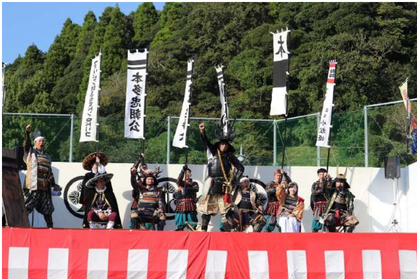
大多喜お城まつりの様子