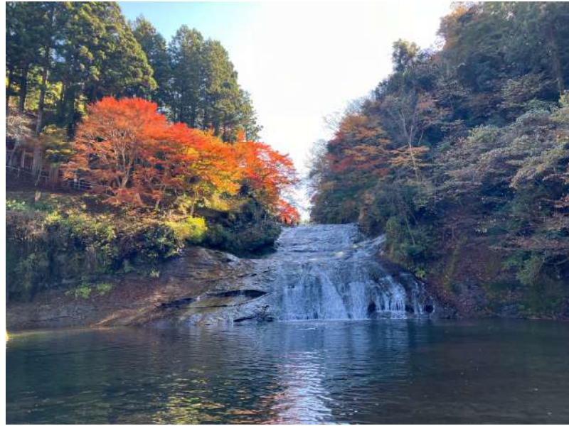
栗又の滝(紅葉)の様子