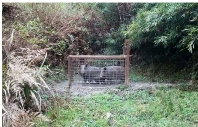
有害鳥獣等への対策の様子