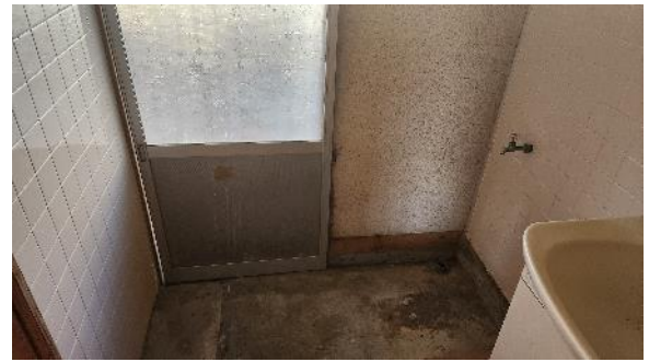
和室 6 畳