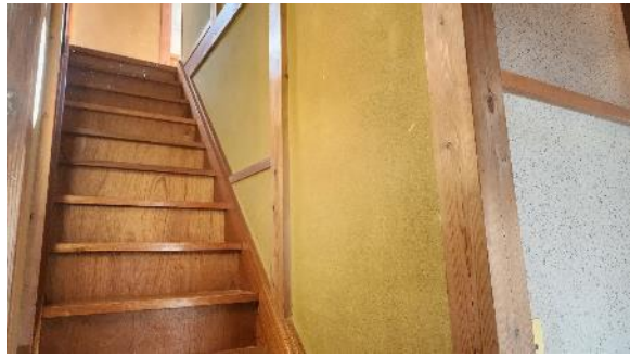
洋室 7.5 畳