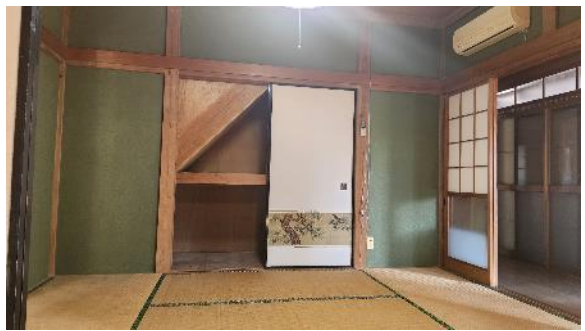
和室 6 畳