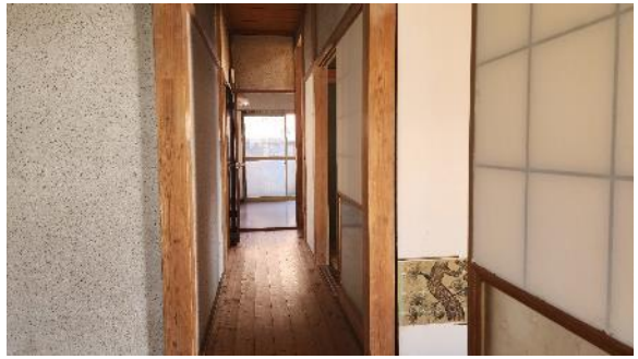
和室 6 畳