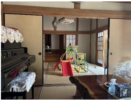
和室 6畳・10畳 (続き間)