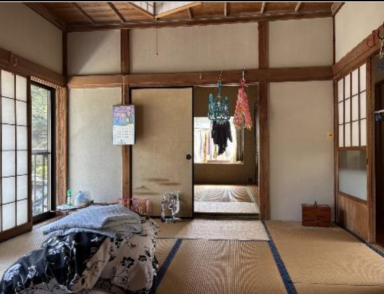
2階和室8畳・8畳 (続き間)