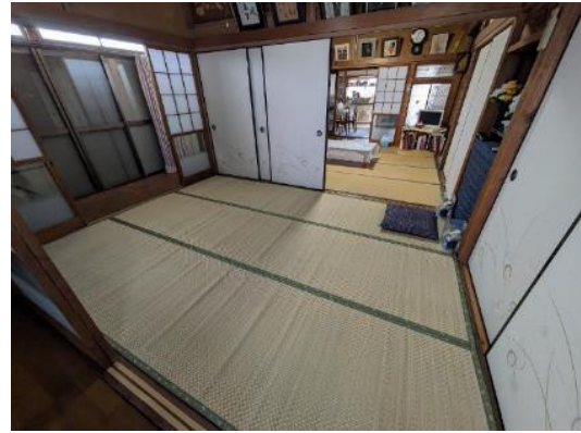
和室 6帖 (続き間)